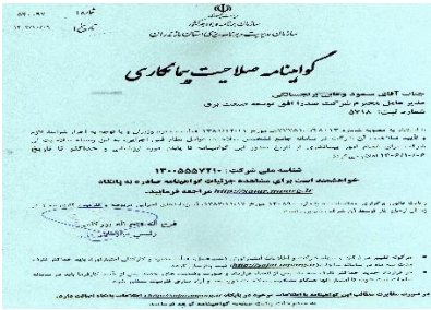
صلاحیت پیمانکاری ارتباطات