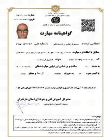
گواهی نامه FTTH