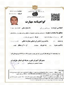
گواهی نامه FTTH