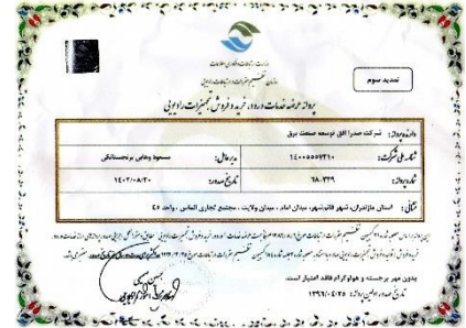
مجوز خدمات ورود و فروش تجهیزات رادیویی