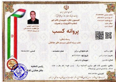
فروشگاه آنلاین مخابراتی