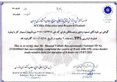
گواهینامه تجارت فرامرزی EPL